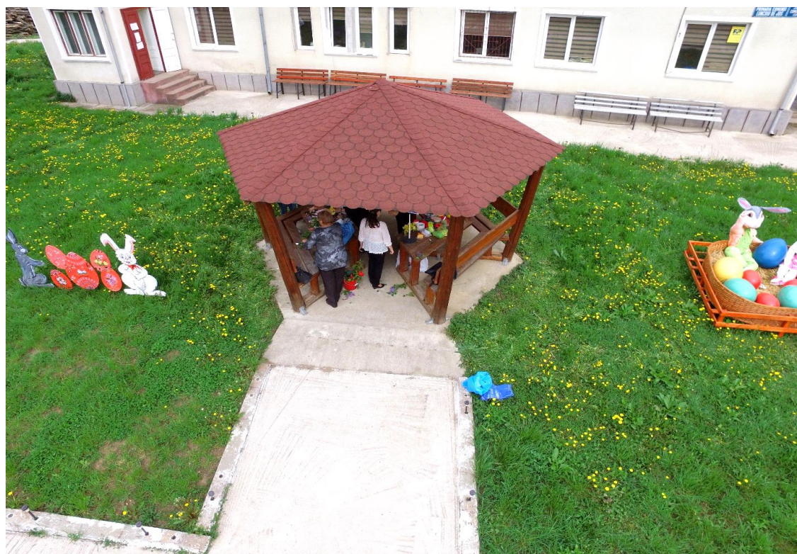
"LUNCOIU DE JOS" oameni faini, tărâm de poveste