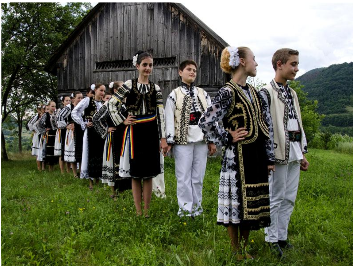
"ȘEZĂTOARE – DE PRIN LUNCOI ADUNATE" suită de dansuri populare zărăndene/ moșești/ românești