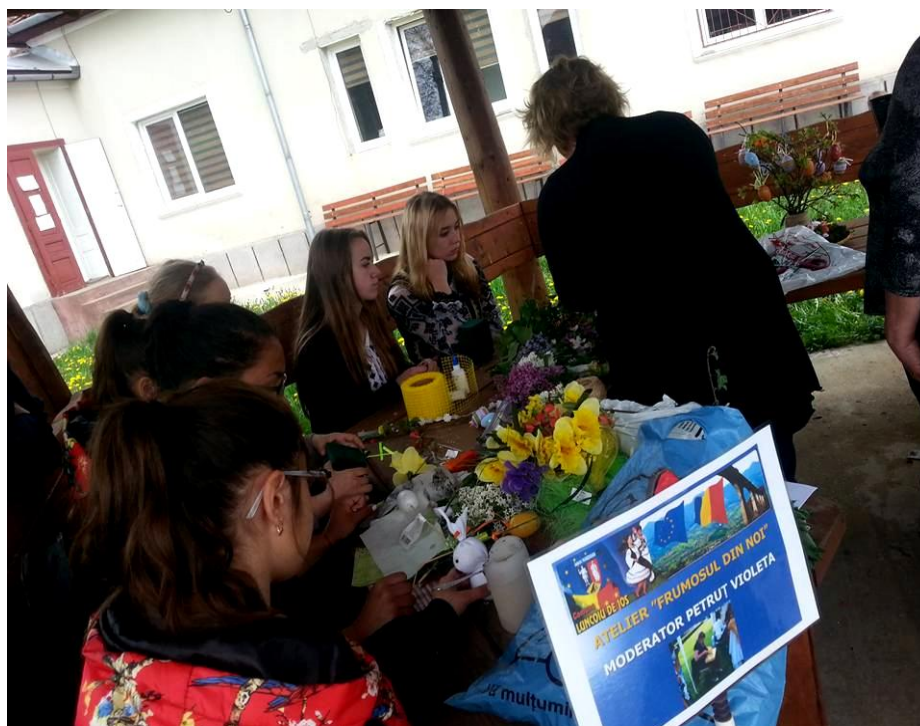
"FRUMOSUL DIN NOI" decorațiuni de Paște