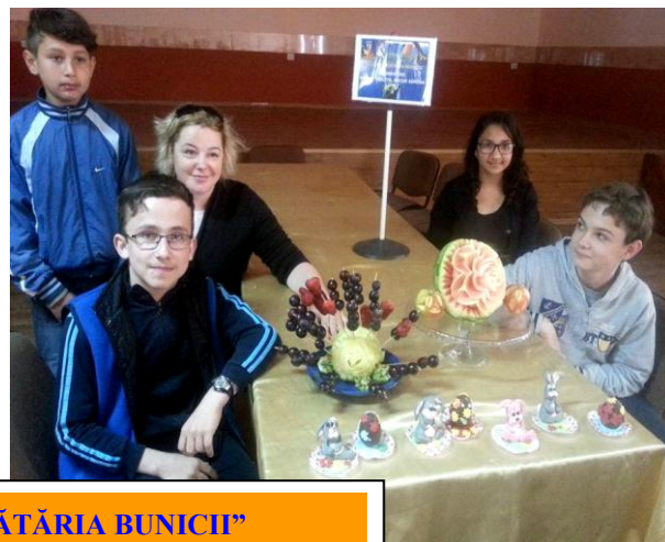
"BUCĂTĂRIA BUNICII" mâncăruri tradiționale