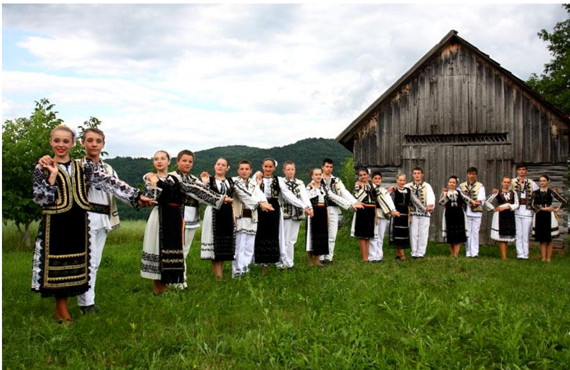
"ȘEZĂTOARE – DE PRIN LUNCOI ADUNATE" ansamblul de dansuri populare "Stejărelul" al Școlii Gimnaziale Luncoiu de Jos