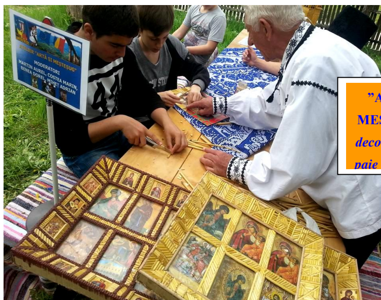
"ARTĂ ȘI MEȘTEȘUG" decorațiuni din paie de porumb