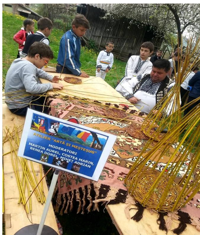
"ARTĂ ȘI MEȘTEȘUG" îpletituri din nuiele