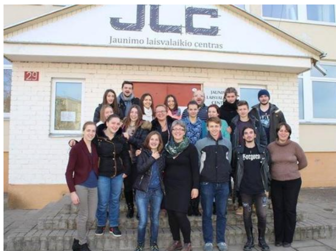
Lituanieni, macedoneni și români în fața Centrului pentru Tineret din Ukmerge, Lituania

Halloween vs. All Souls' Day Proiect Erasmus+K1 desfășurat în Lituania, octombrie-noiembrie 2015