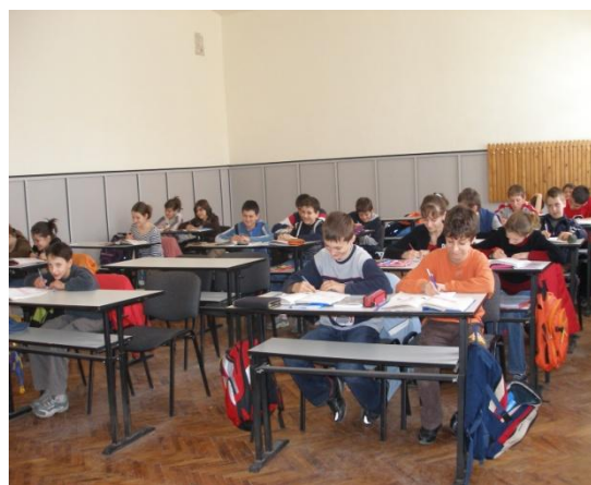
săli de clasă