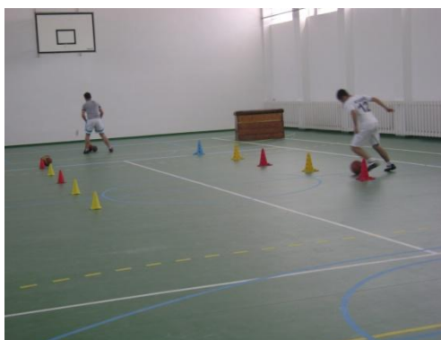
sală de sport