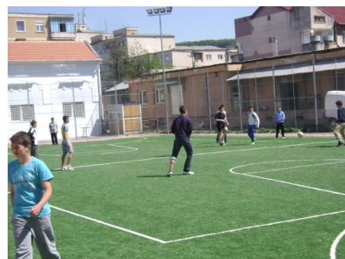
teren de sport