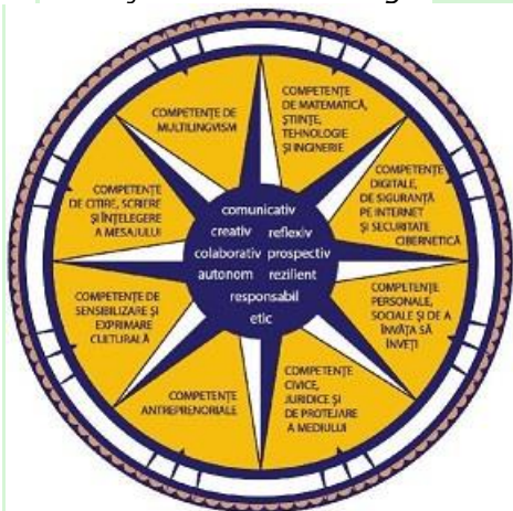
Figura 1*). Dimensiuni principale care contribuie la definirea profilului de formare al absolventului

Profilul de formare al absolventului funcționează ca o busolă pentru întregul sistem educațional, în care elementele continuumului predare-învățare-evaluare conlucrează pentru realizarea idealului educațional definit în lege.