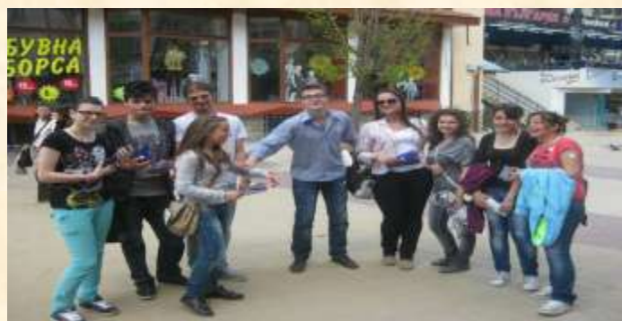
Smolyan – Bulgaria