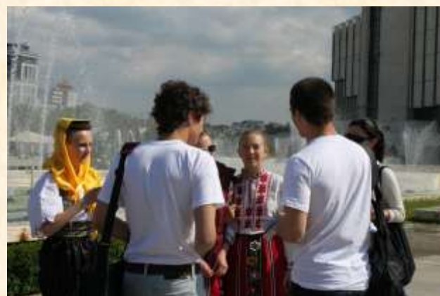
Sofia – Bulgaria