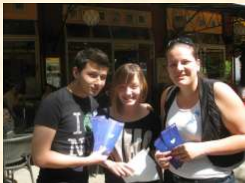
Burgas – Bulgaria

Să iubim lumea și să oferim un zâmbet curat celor din jurul nostru!