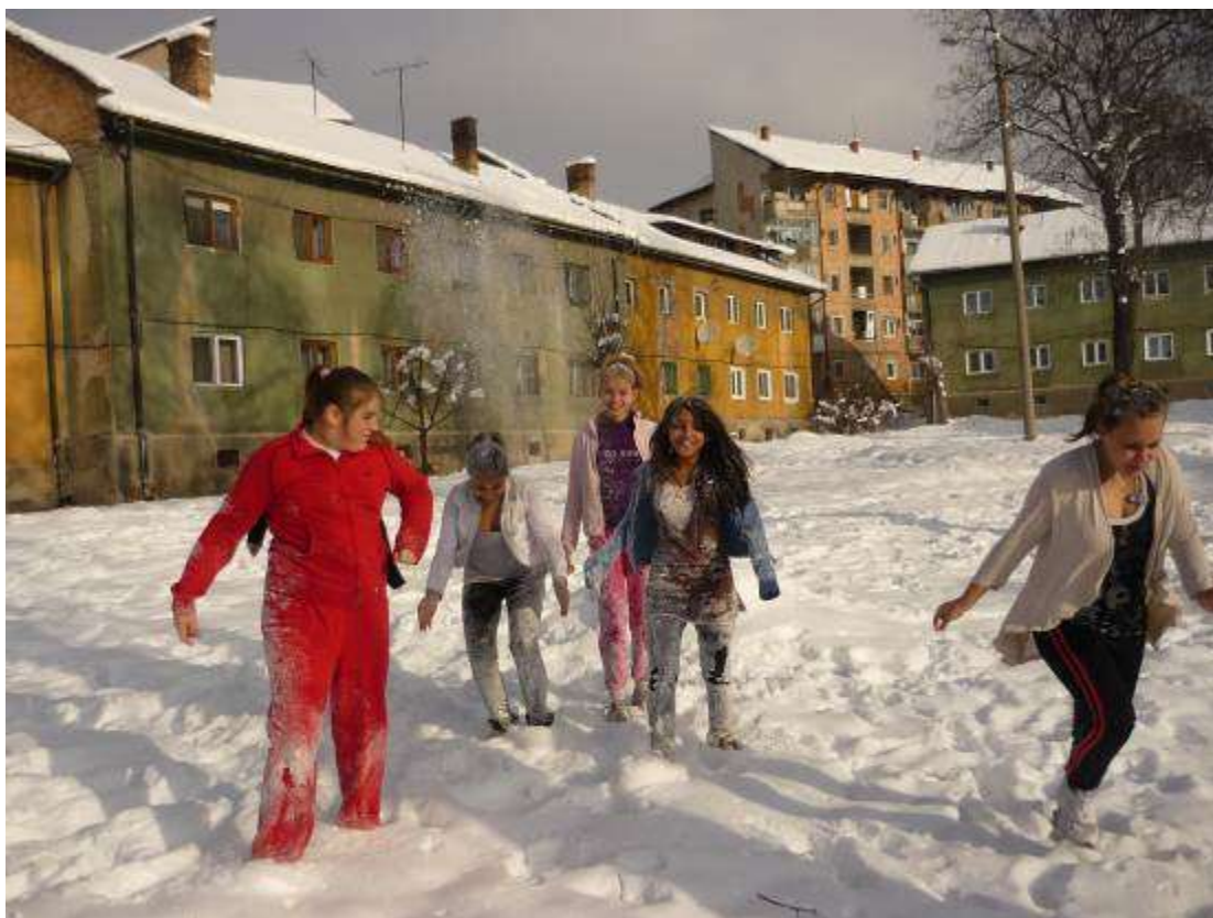
Fotografii făcute de elevii de la cercul de „Fotografie digitală” de la Clubul Copiilor din Petroșani.