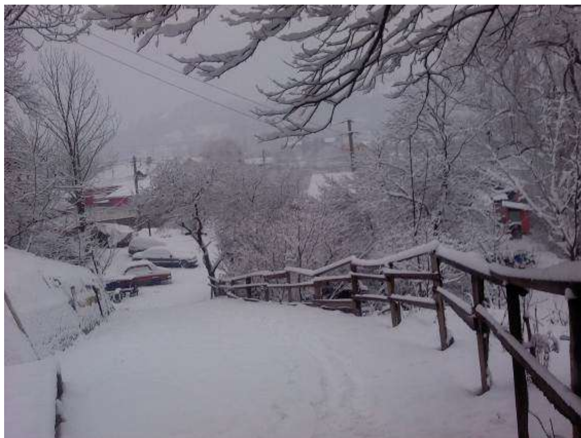
Fotografii realizate în cadrul cercului de Fotografie digitală.