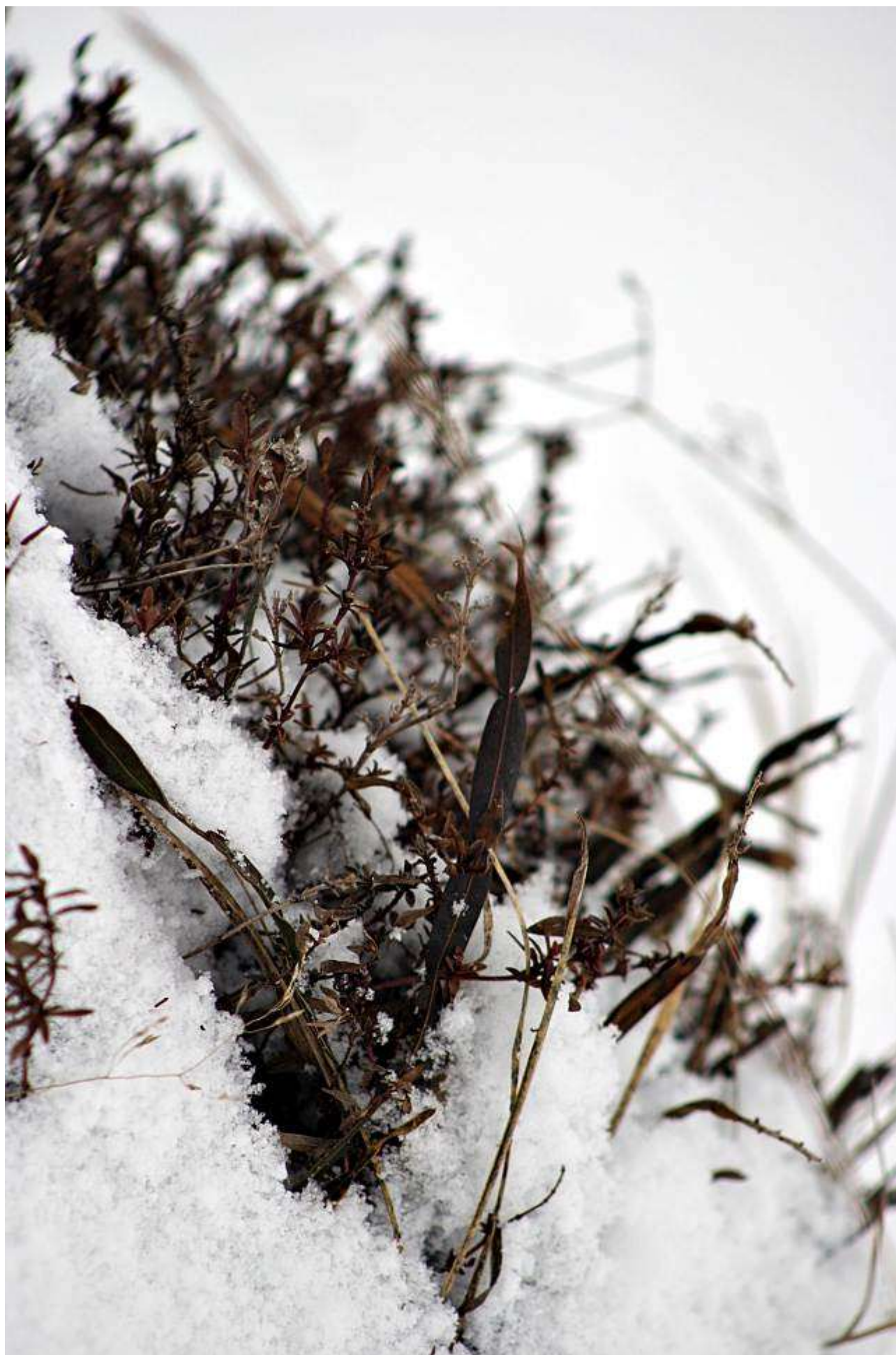
Autor : Negoii Gabriel – colegiul Hermes Petrosani.