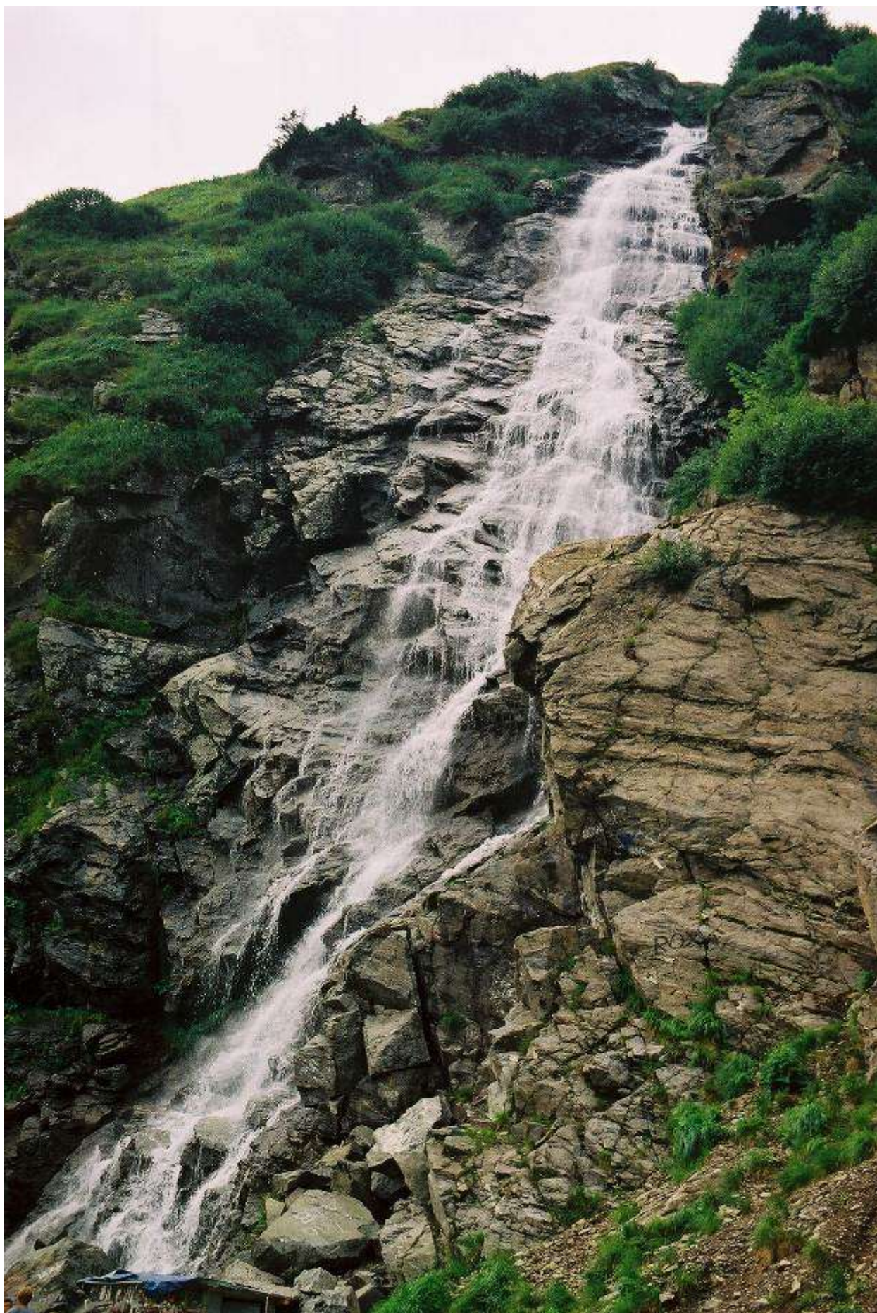
CASCADA DIN MUNTII FAGARAS Autor : Ingustu Razvan , Clasa a VI-a