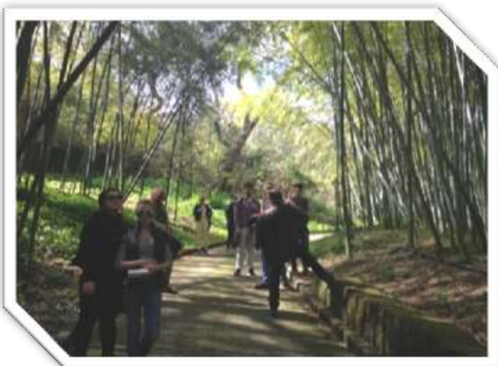
Fluxuri 6 și 7, martie 2016, Italia