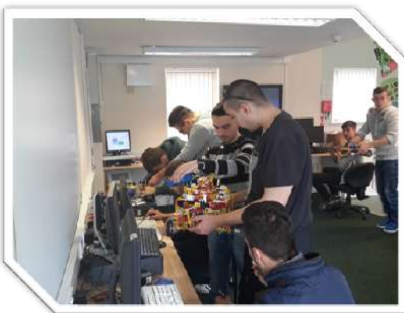
Flux 8- aprilie 2016, Anglia