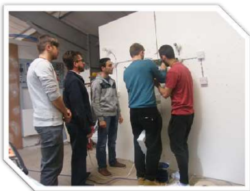
Flux 4- mai 2015, Anglia