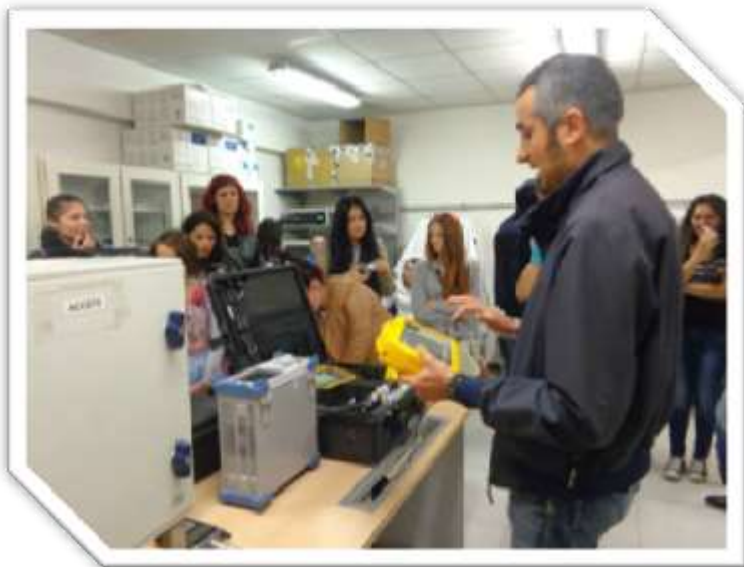
Fluxuri 2 și 3 - aprilie 2015, Italia