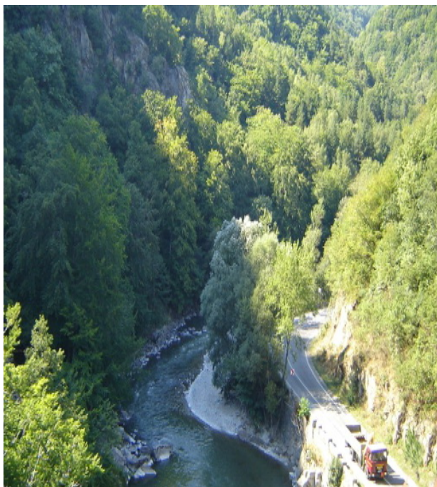
A. Râul Jiu – sector între Livezeni și Bumbești-Jiu