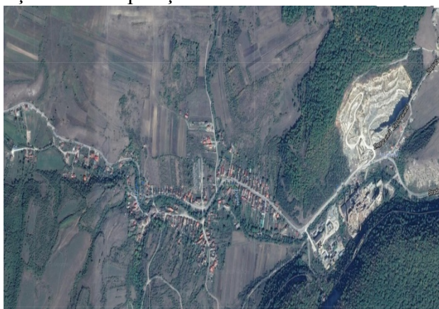
Foto1. Așezare rurală