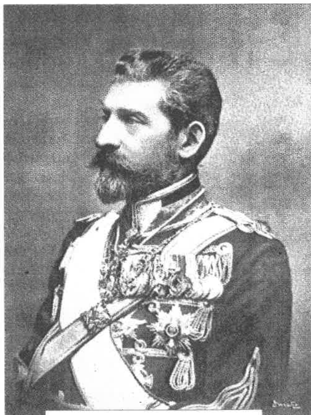
Ferdinand I, rege al României.

Observatorul militar vă prezintă, în trei numere consecutiv, pagini dedicate celor trei bătălii din vara anului 1917, de la Mărăști, Mărășești și Oituz, în care militarii români au înscris în cartea de istorie a neamului pagini de glorie și eroism legendar. Lor li se adresează regele Ferdinand I, la 12/25 august 1917, astfel: „Cu piepturile voastre ați ridicat un zid mai tare decât granitul. (...)”