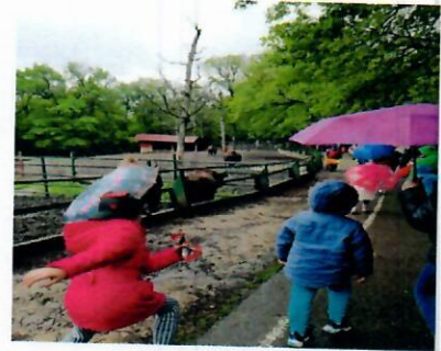
- Activități distractive la locuri de joacă