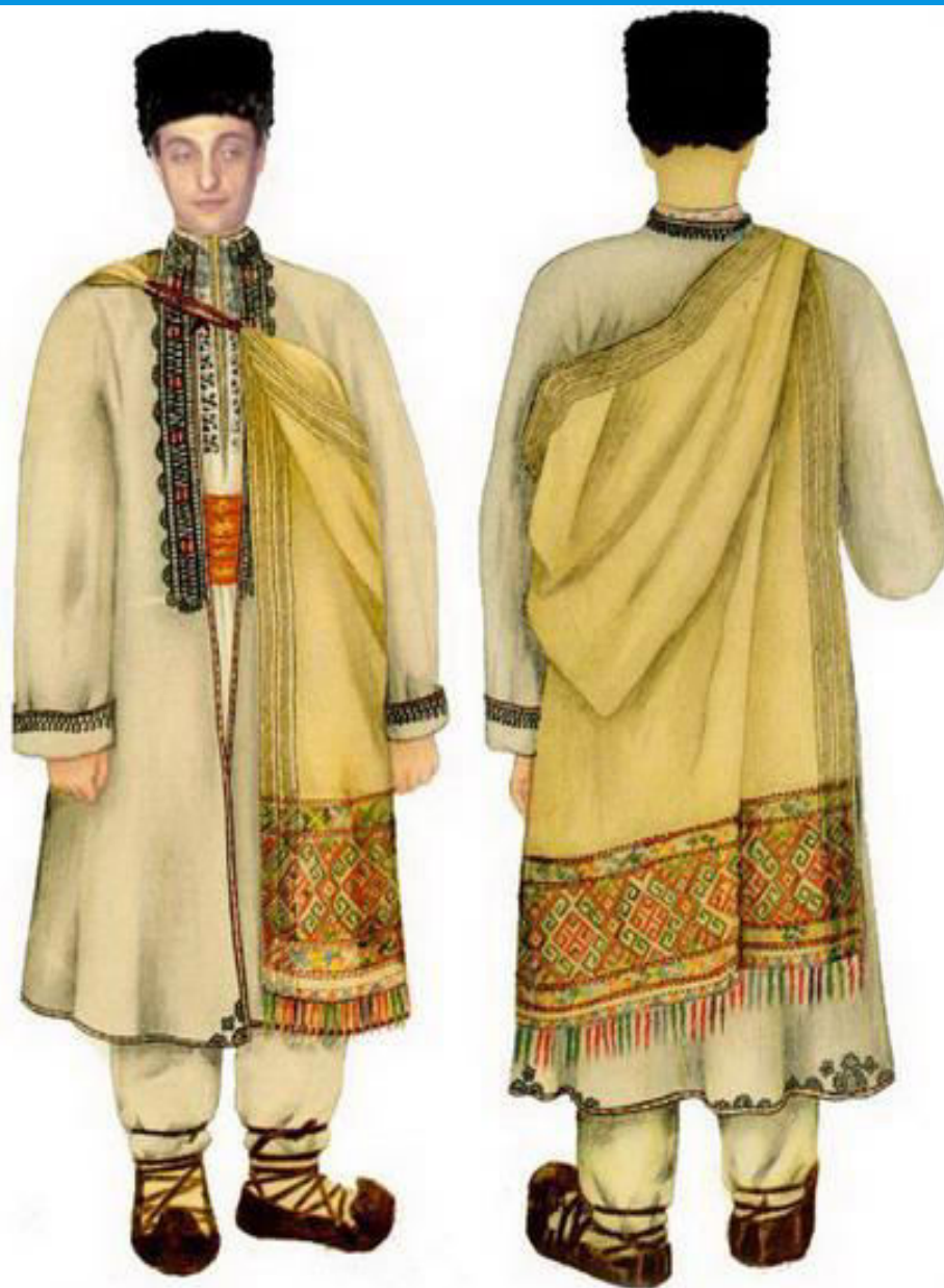
COSTUME POPULARE DIN ZONA HAȚEGULUI-