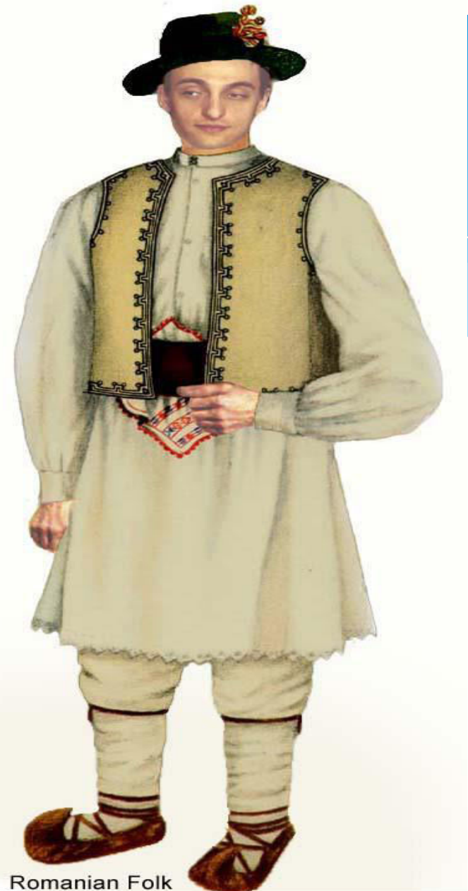
Romanian Folk Costume, Man from Pădureni, Hațeg