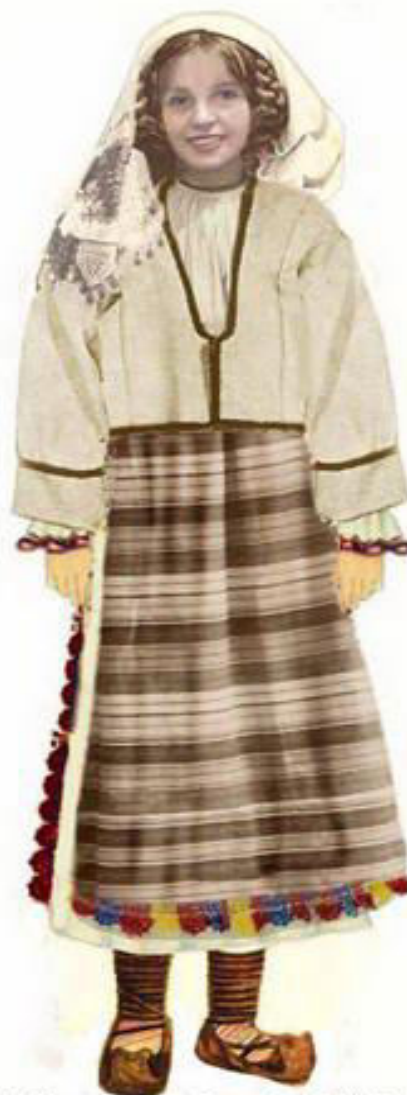
RomanianMuseum.com: Romanian Folk Costumes West-Jiu Valley (Momărlani)