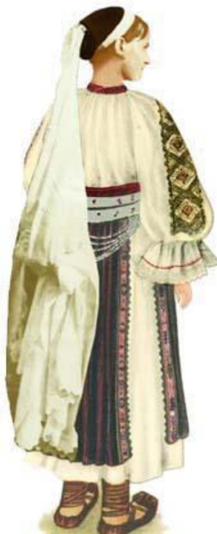
Woman from Meria with CEAPSA and hanging PROPOADA (veil)