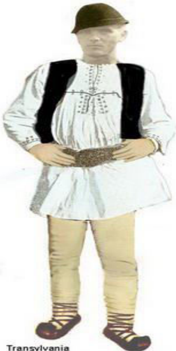
Transylvania Momărlan man in summer outfit, wearing "câmașă cu barburi"