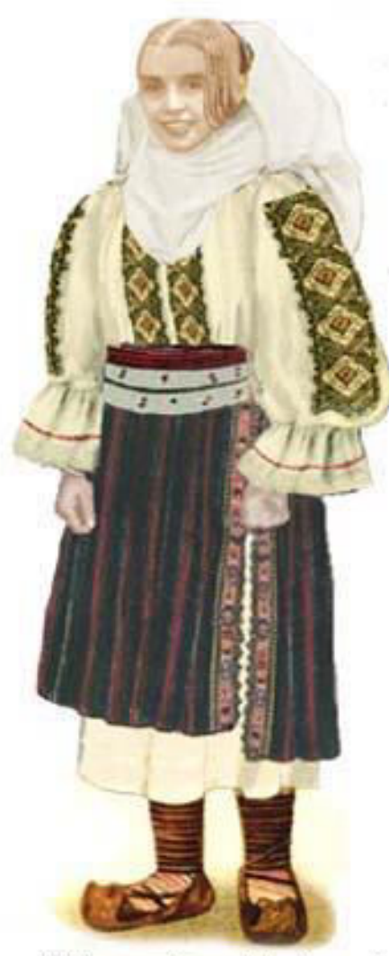
Woman from Meria with CEAPSA and wrap-around PROBOADA