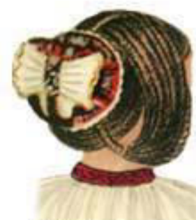
Hair & Ceapsa detail