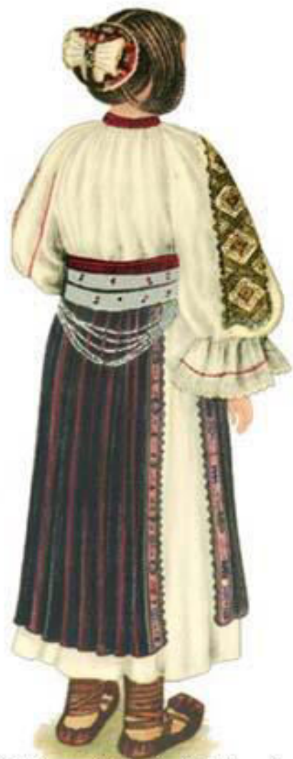
Girl from Meria (Hateg) with CEAPSA (hat)