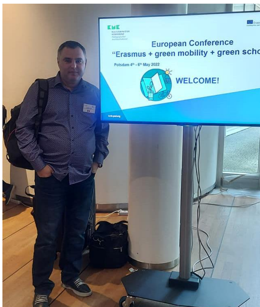
Realizat de - Profesor : Cioată Ilie Nelu Liceul Tehnologic "Retezat" Uricani