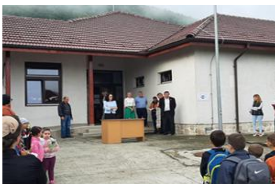
Școala Primară Vețel