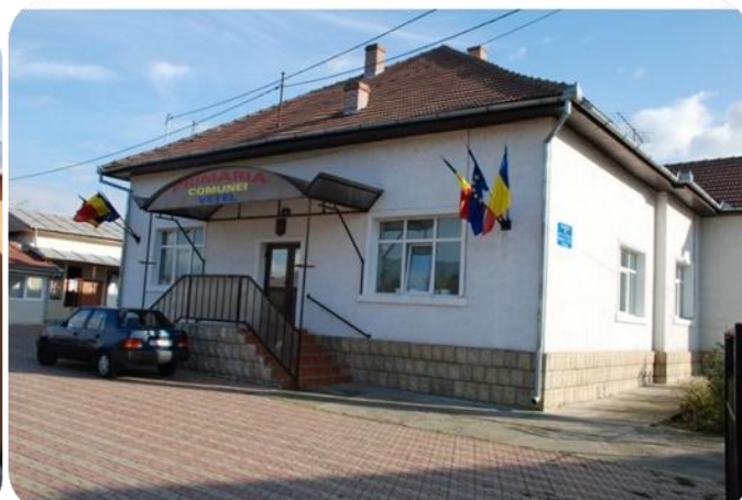
Primăria Comunei Vețel