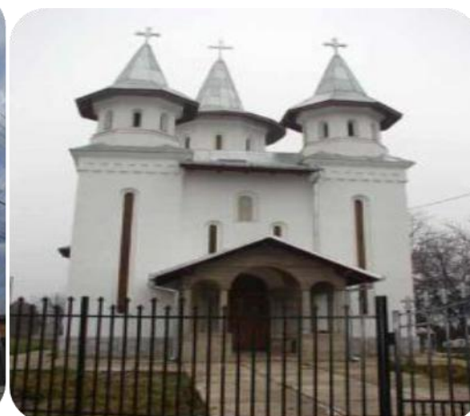
Biserica din Mintia