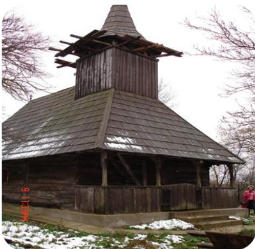
Biserica din Boia Bîrzii