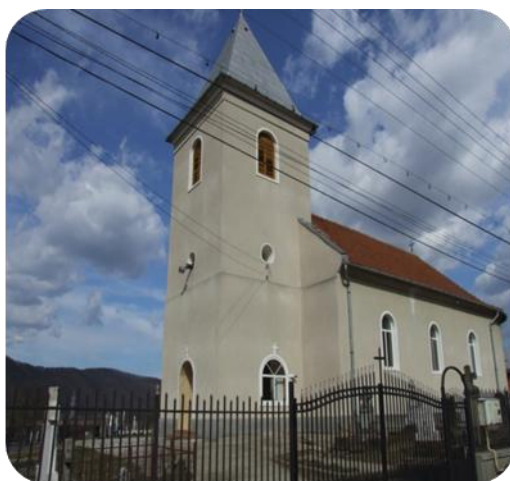
Biserica din Veșel