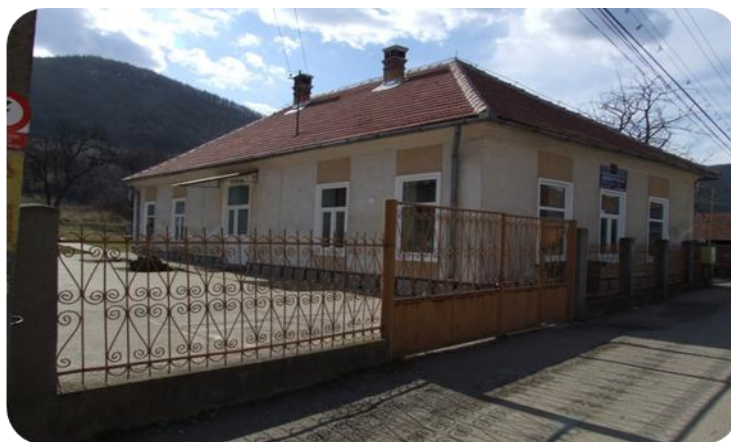
Școala Primară Vețel (clădire veche)