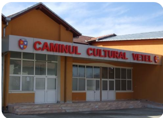
Căminul Cultural Vețel