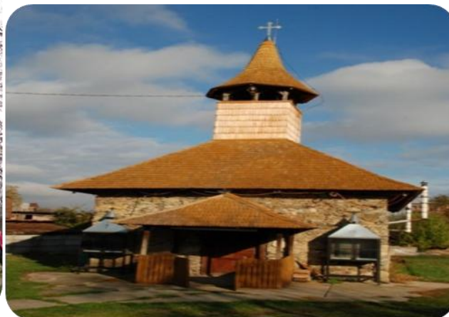
Biserica din Leșnic