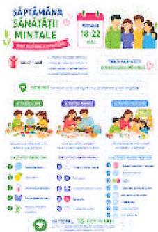
Infografic - Saptamana Sanatatii Mintale.jpeg 269K