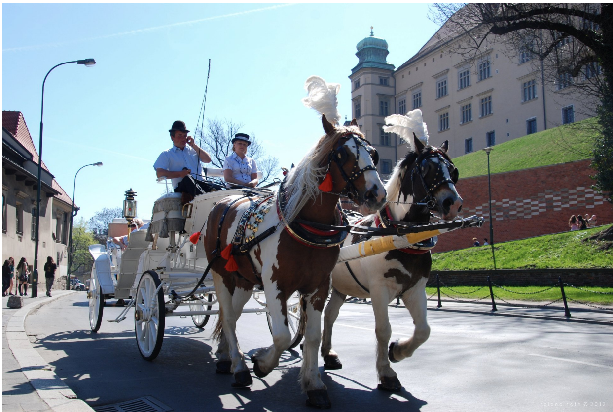
Grupul în fața castelului renaștivist de pe dealul Wavel