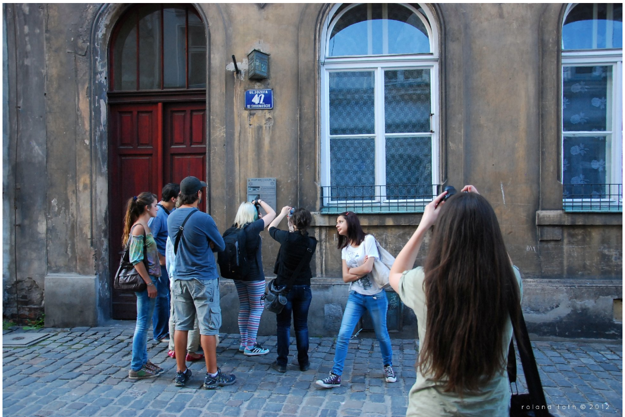
Cracovia Piața Veche și Cartierul evreiesc