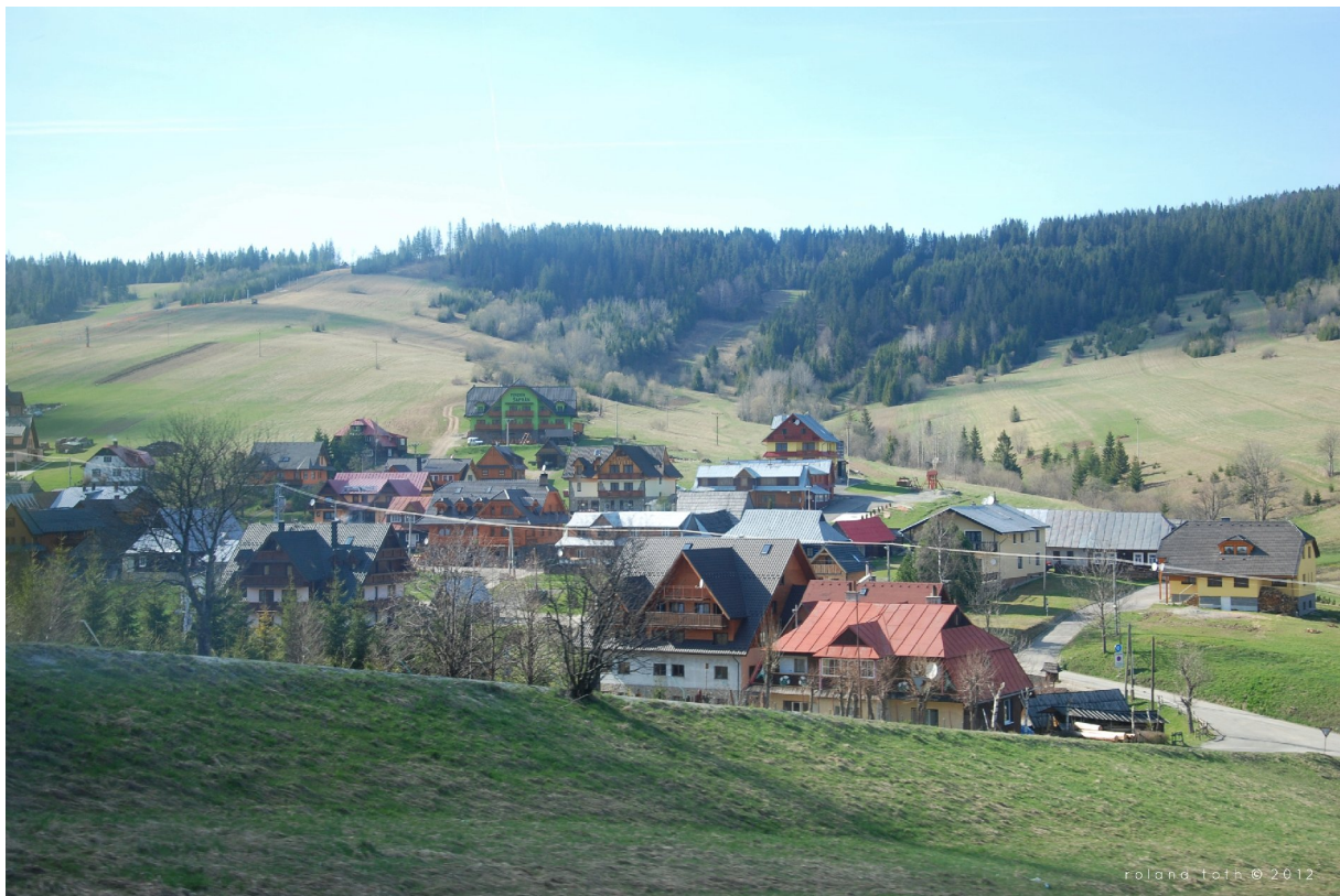
Munții Tatra și stațiunea Zacoanie