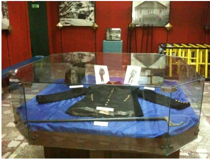
Activitatea „9 Mai în istoria neamului nostru”