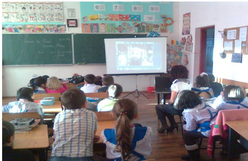
Activitatea „Unire-n cuget și-n simțiri!”