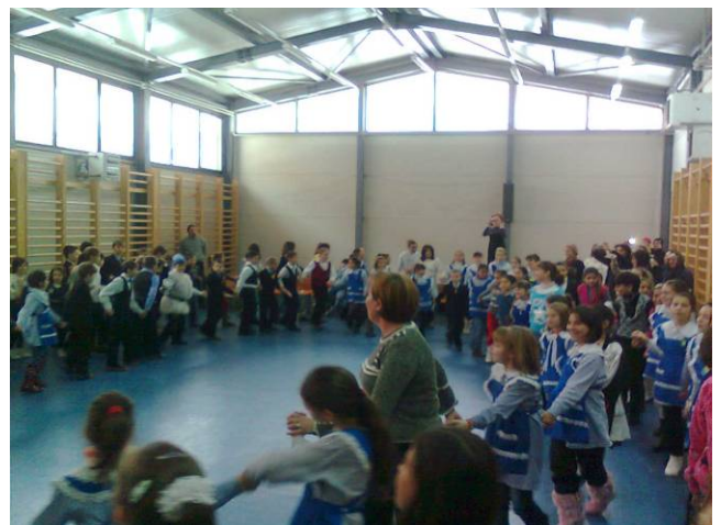
Activitatea „Să pătrundem în tainele istoriei mineritului”