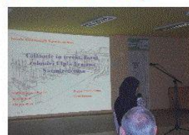
Prezentări power point