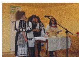
Tradițiile comunității mele