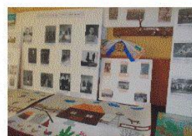
Imagini din comunitatea mea